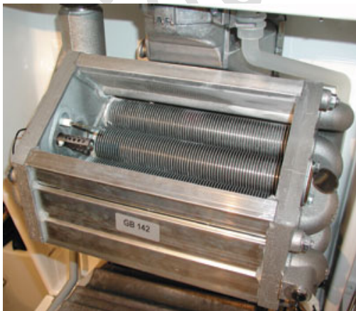
Čist, gotovo novi izmjenjivač GB 112